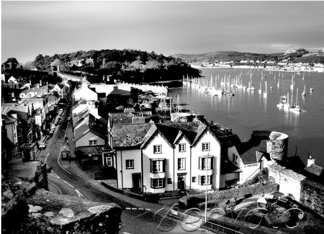
Image Caption. Feugiam, quat laortin velissi tat irit laore essect magna am del utpat lore dolesed duisl doloboreet, vulpute do dui te delit lut praesto cortism oloreetum veliquatis num alisi blaor iliquam dolortismod dolorpero od minciduis dunt prat lort.

atet dionsequam zrrilis amcommodo consendre vulla facipisisim iurerat. Ro con velit vent nullaor iure modolor erotie dipis nisi.